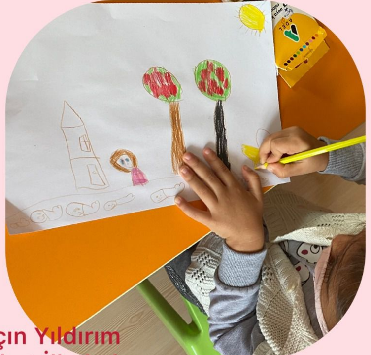
Dilek Darçın Yıldırım Hüseyin Alhat İlkokulu